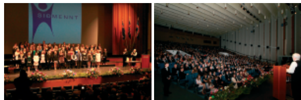
Fyrir fullum sal af fólki. Borgaraleg ferming 2010 í Háskólabíói.

Skoðaðir verða möguleikar á athöfnum á fleiri stöðum eftir því sem áhugi og þátttaka eykst.